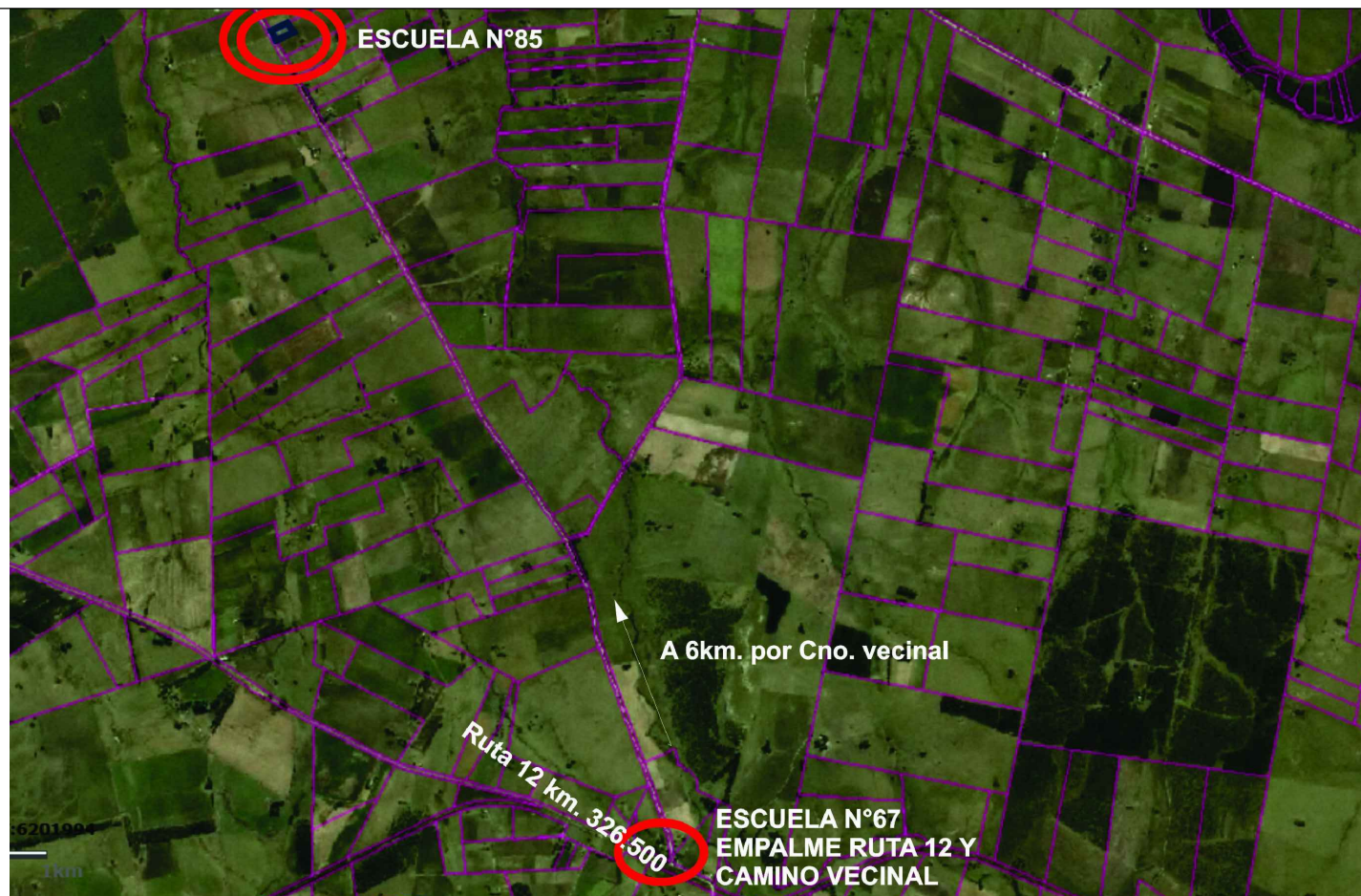
PLANTA DE UBICACIÒN Esc S/E